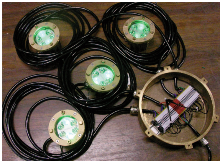
BCIE pour mise en série de 4 projecteurs RVB BCIE for connection of 4 RGB LED spotlights